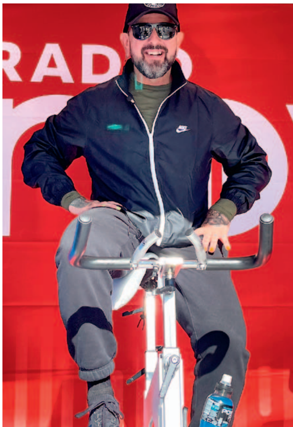
KUVA KUMMIT & RADIO NOVA

Kaupallisen viestinnän ja markkinoinnin toimisto Republic on Lastenklินิกoiden Kummien strateginen viestintäkumppani. Republic tukee Kummeja mm. alueellisen ja valtakunnallisen viestinnän suunnittelussa sekä toteutuksessa, sidosryhmäviestinnän työkalujen kehittämisessä, visuaalisessa viestinnässä sekä organisaation viestintävalmiuksien edistämässä.