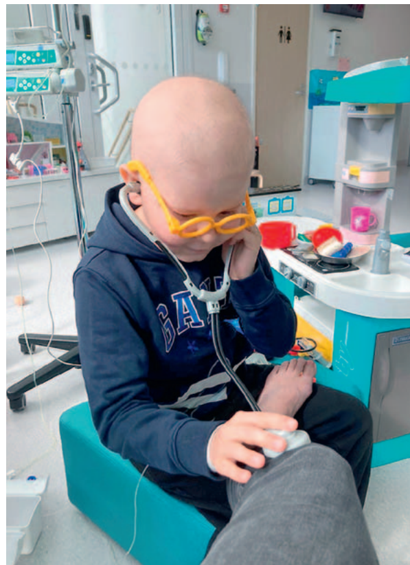
KUVA LUKAKSEN PERHEEN KOTIALBUMI

Vuoden 2023 aikana tiedotusvälineitä lähestyttiin mm. Kummien pääkampanjojen, hankkeiden, tapahtumien sekä yritys yhteistyön tiimoilta. PressitilaisuuDET järjestettiin Elämä Lapselle- sekä Joulumielelle-konsertin yhteydessä. Valtakunnallisen uutiskynnyksen kattavasti ylitti yhteistyössä Suomen Rehtorit ry:n sekä MTV Uutisten kanssa toteutettu rehtorikysely lasten ja nuorten koulupoissaoloista, jonka yhteydessä nostettiin esille lasten mielenterveys sekä Kummien käynnissä olevat mielenterveyshankkeet. Helsingin Sanomat teki keväällä laajan jutun LastenkliniKoiden Kummien 30-vuotisesta työstä.