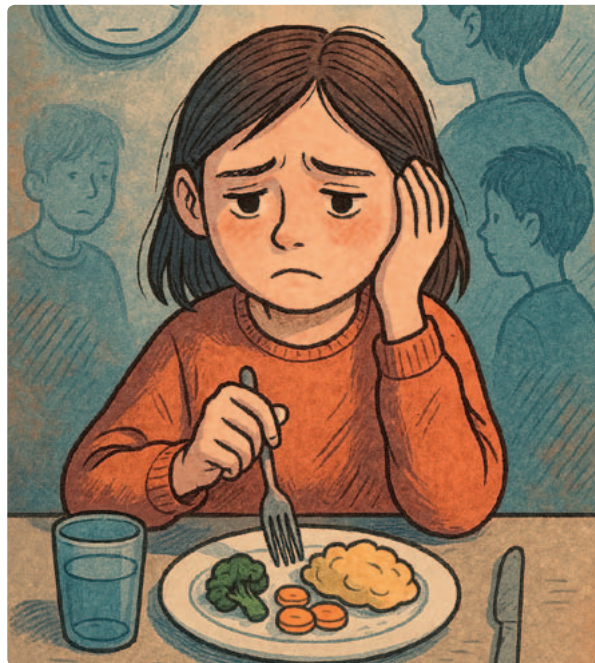
KUVA LUOTU COPILOTIN AVULLA

tarpeellinen arviolta noin 30 %:lle syömishäiriötä sairastavista lapsista ja nuorista, joiden painonkehitys ei korjaannu pelkällä FBT-perhehoitomallilla ja jotka ohjautuvat usein myös lastenpsykiatriseen osastohoitoon. Uusi hanke vahvistaa hoidon vaikuttavuutta ja auttaa turvaamaan paremman, turvallisemman ja toipumista tukevan hoitopolun kaikkein vaikeimmin oireileville lapsille ja heidän perheilleen.